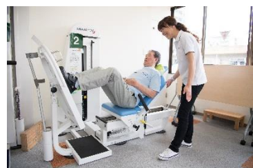
・無理のない安全なリハビリが、 座ったままで行えます!

“軽い重さで安全なリハビリ・トレーニングマシン”を使用したパワーリハビリテーションを体験しませんか? とても軽い負荷でおこなえます。お風呂に入るより体への負荷は少ないのです! ご利用者様の身体機能・生活動作の回復をスタッフ全員で目指します。