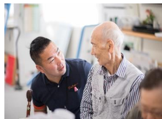
・ご利用者様の改善が何よりの 喜びです◎